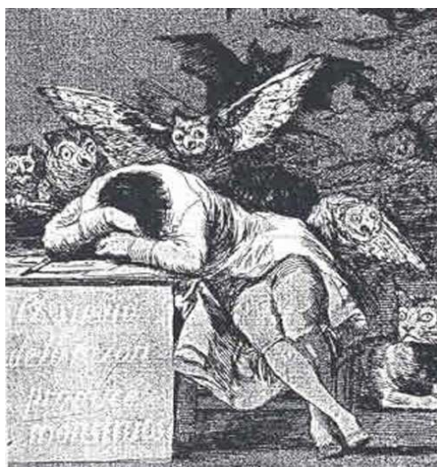
GOYA. IL SONNO DELLA RAGIONE