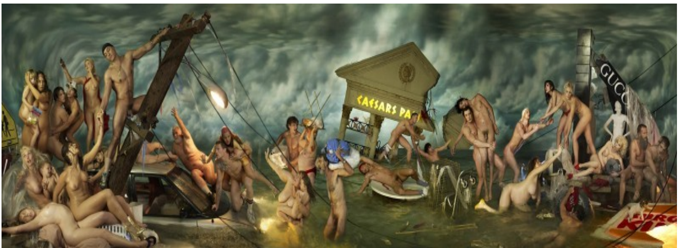
LA CHAPELLE. DELUGE

UN QUARTO DI TUTTA LA CO 2 EMESSA DALL'UMANITÀ DAL 1750 A OGGI È STATA EMESSA TRA IL 2000 E IL 2010