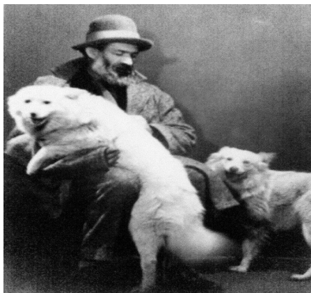
COSTANTIN BRÂNCUȘI E I SUOI CANI