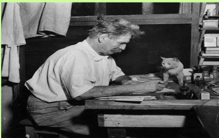
EINSTEIN E IL GATTO