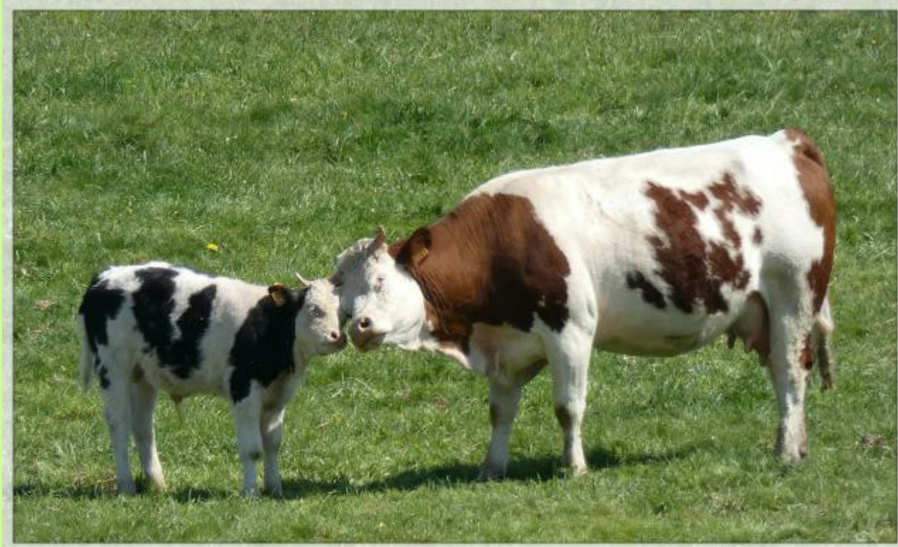
Mucca e vitello.