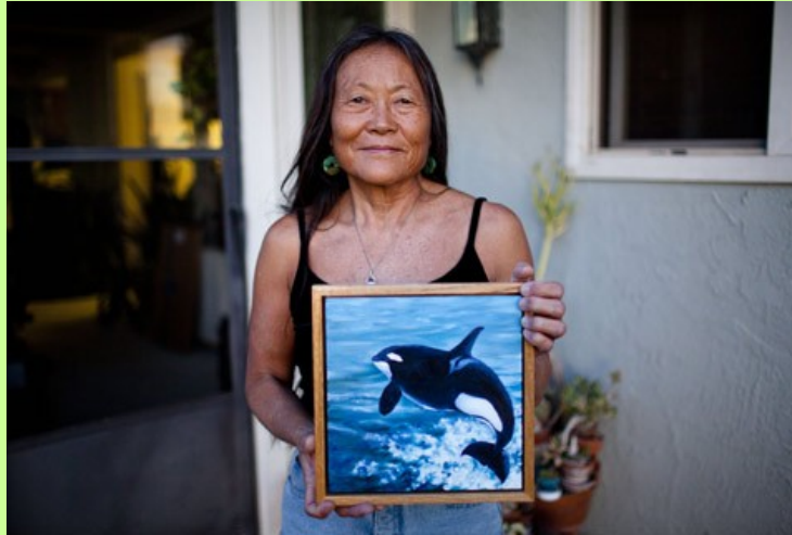
PEGGY OKI LA DONNA DELLE BALENE

https://www.youtube.com/watch?v=ycB29FkoylE&feature=share&fbclid=IwAR0qYKktewzhu4eUl-JFYhCGYlaK3Qip03tdA8Pj2nsYjqNMSXm3zVAkZU8